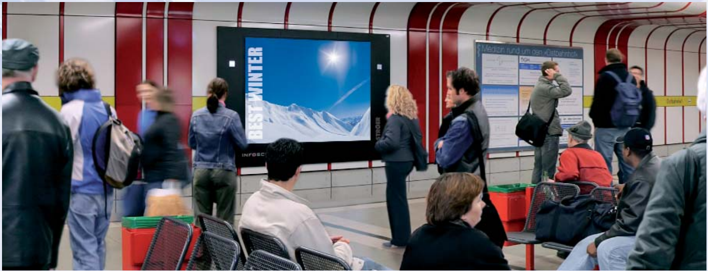
Infoscreen - Deutschland und Österreich