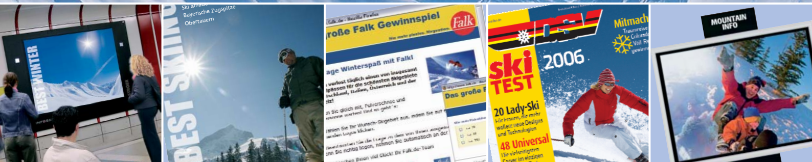
Ski am See Bayerische Zugspitze Obertauern