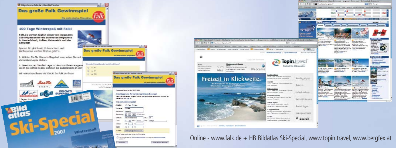
Online - www.falk.de + HB Bildatlas Ski-Special, www.topin.travel, www.bergfex.at