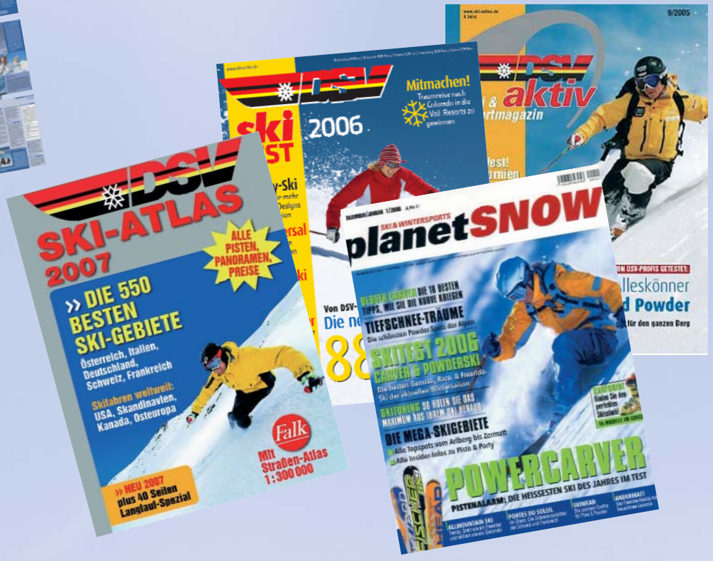
DSV-Ski Aktiv, DSV-Skitest, DSV-Ski-Atlas, Planet Snow